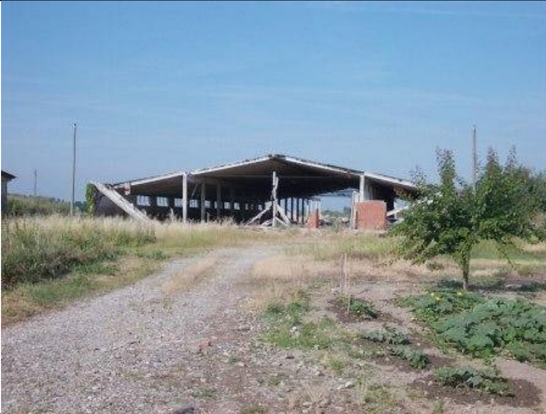
MIR CA 35 (3)