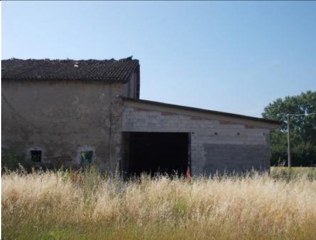
MIR CA 35 (1)