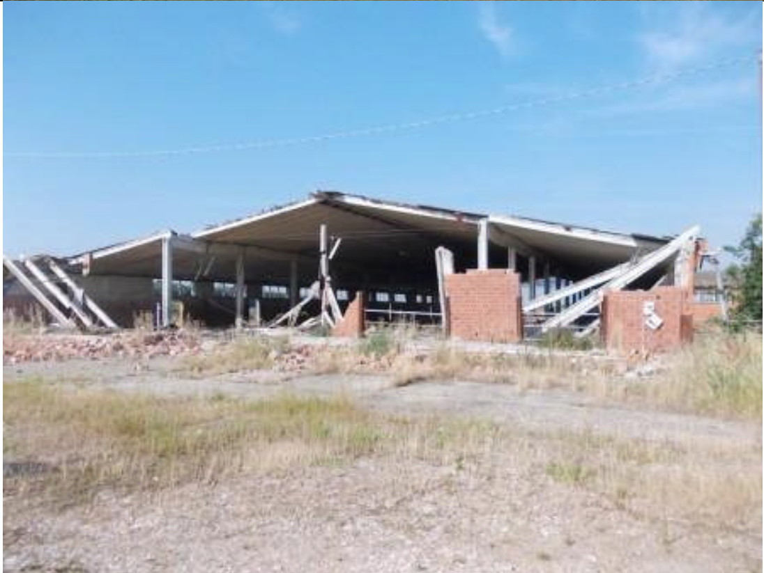
MIR CA 35 (2)