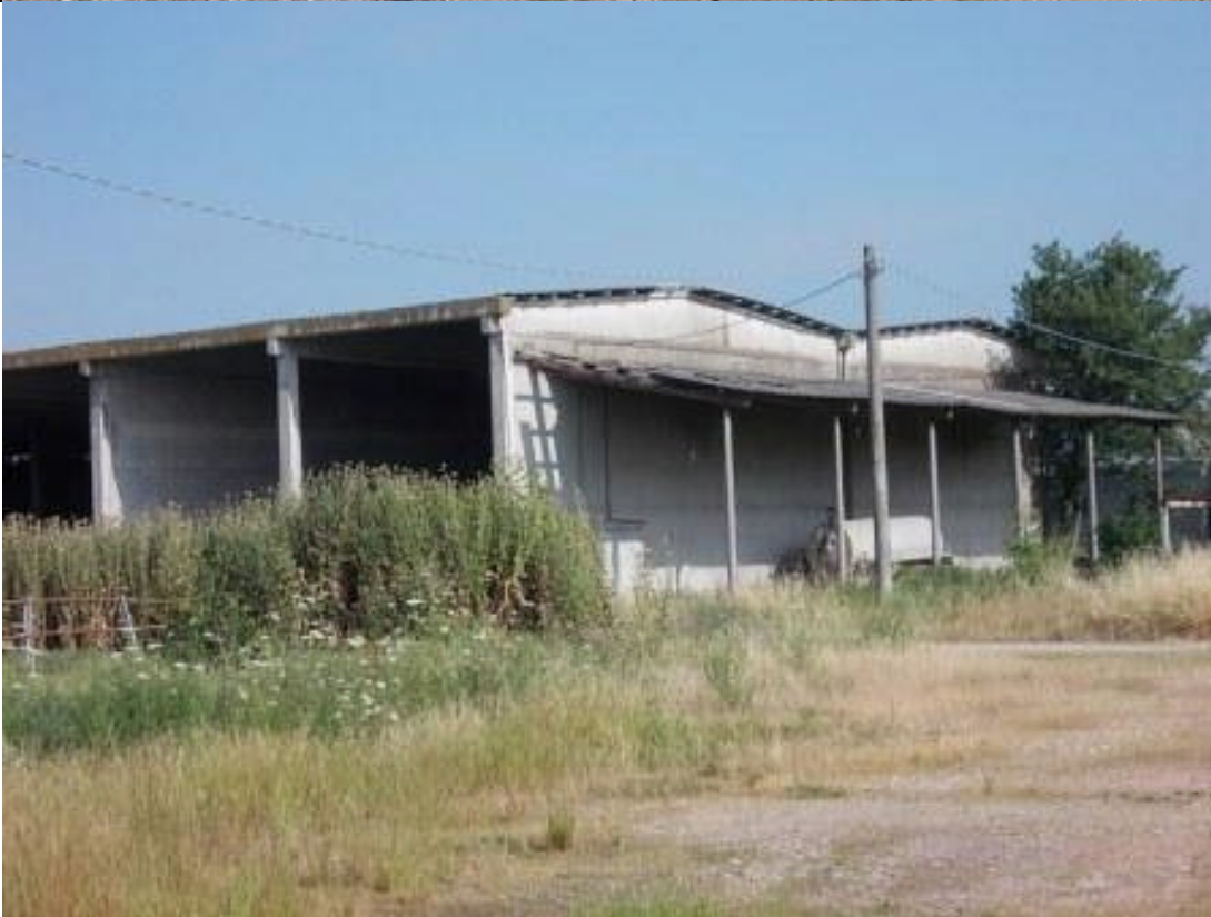
MIR CA 35 (4)